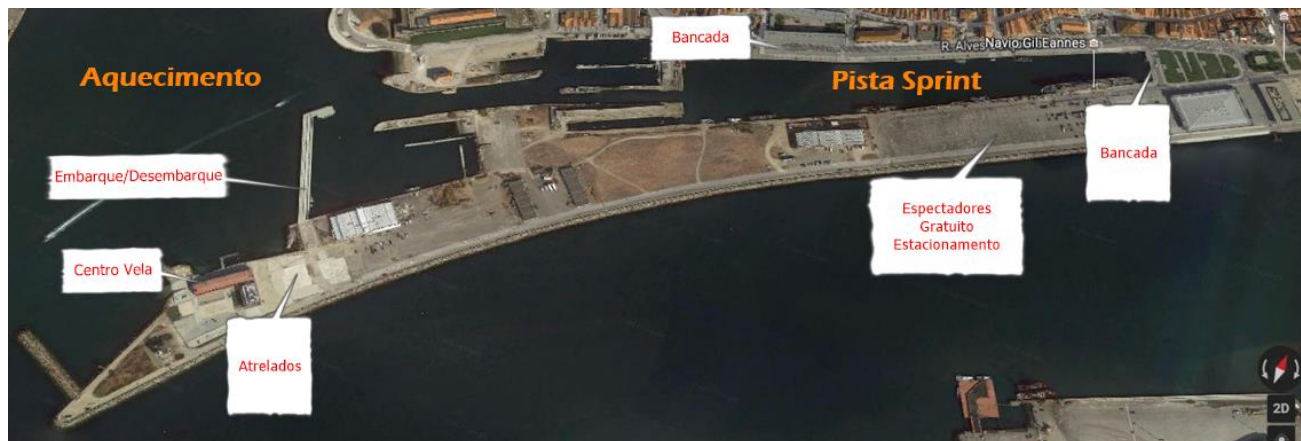
Mapa Geral Campo de Regatas SÁBADO